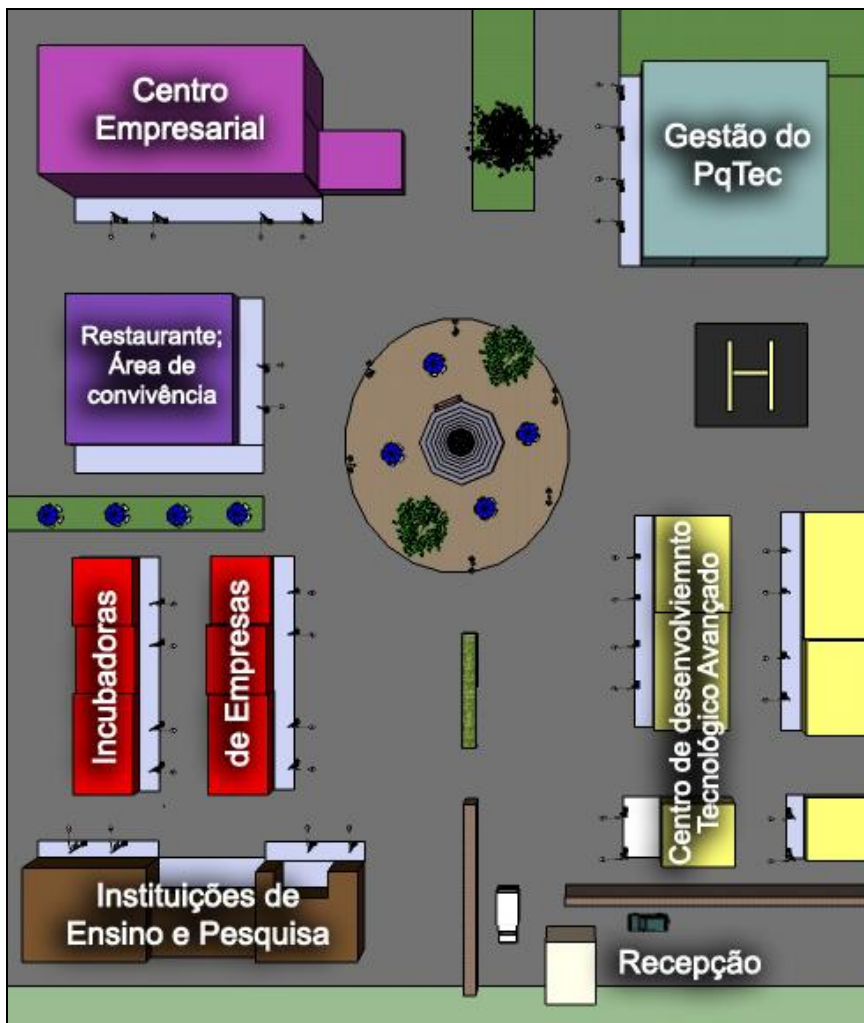
Figura 2: Modelo de Parque Tecnológico com ênfase em TIC para o VPP

- Centro de desenvolvimento tecnológico avançado: constituída de empresas âncoras que favoreçam o crescimento do parque. Mesma estrutura do centro empresarial, com a disponibilização de laboratórios de alta tecnologia para pesquisa.